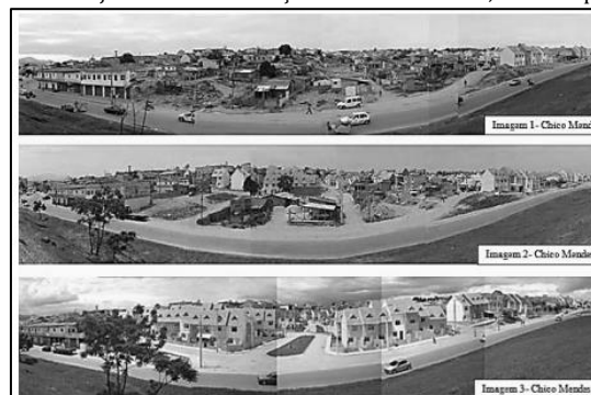
Figura 08 – Projeto de reurbanização de Chico Mendes, Florianópolis-SC.

Desta forma, levando em consideração todo o estudo das principais estratégias apresentadas, que contribuem para se desenvolver uma forma de prevenção de crimes e da violência através da arquitetura e do desenho urbano. Foi pesquisado então um experimento nacional que demonstram a eficácia das estratégias. Experimento esse mostrado na figura 08.