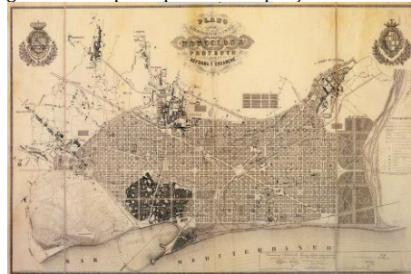
Figura 01 – Mapa do plano de ampliação de Barcelona.

Segundo o livro “Teoria General de la Urbanización”, de Soria e Puig (1867), o grande responsável pela criação do termo Urbanismo, na época moderna, foi o engenheiro catalão Ildefonso Cerdà, que criou o projeto de ampliação da cidade de Barcelona na década de 50, do século XIX (figura 01). Esta hoje, consiste em boa parte decorrente do plano Cerdà, sobre ideologias do “urbanismo humanista” que estabeleceu estruturas em quadrículos, abrindo novas ruas e mais largas, além de exigir a implantação de áreas verdes dentro das quadras, definindo altura máxima das edificações, implantando equipamentos comunitários ao longo dos quarteirões, e deixando as zonas industriais mais afastadas do centro da cidade (Soria; Puig, 1968).